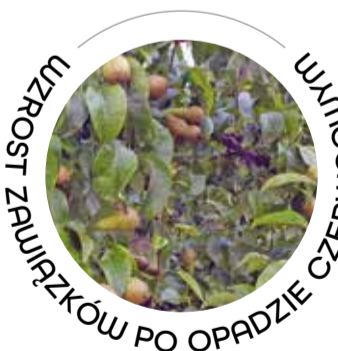
WZROST ZAWIĄZKÓW PO OPADZIE CZERWIEM