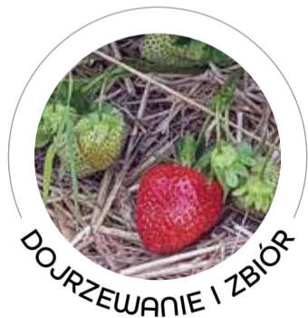
DOJRZEWANIE I ZBIÓR