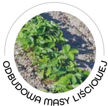
ODBUDOWA MASY LIŚCIOWEJ