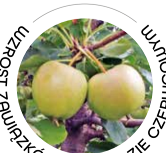
WZROST ZAWIĄZKÓW PO OPADZIE CZERCH