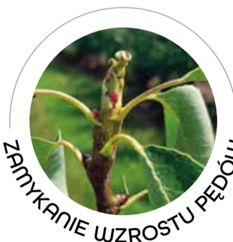
ZAMYKANIE WZROSTU PĘDÓW