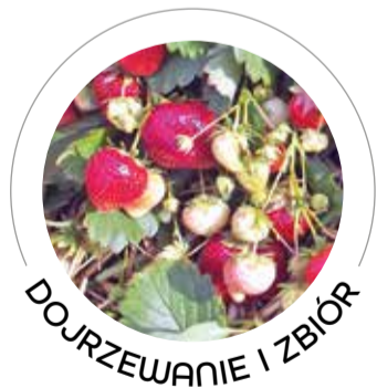
DOJRZEWANIE I ZBIÓR