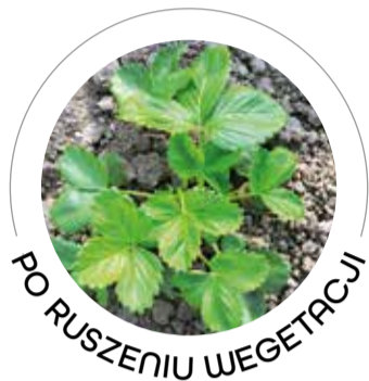
PO RUSZENIU WEGETACJI

HUMMILEAF LIFE 1-2 l/ha PoliChron 1 l/ha