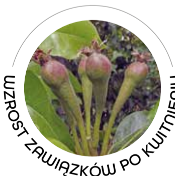
WZROST ZAWIĄZKÓW PO KWITNIENIU

HUMMILEAF LIFE (Do zabiegów z Fungycydami, nawozami mineralnymi i odżywkami) 1-2 l/ha