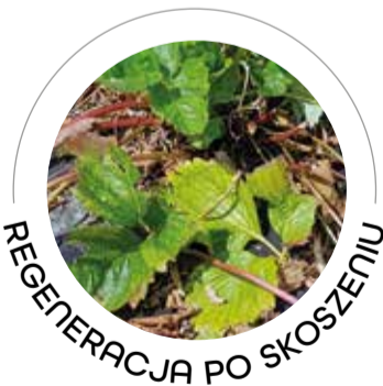
REGENERACJA PO SKOSZENIU