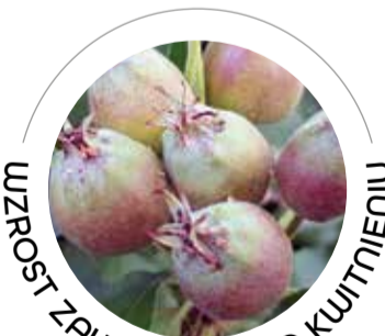
WZROST ZAWIĄZKÓW PO KWITNIENIU

HUMMILEAF LIFE (Do zabiegów z Fungicydami, nawozami mineralnymi i odżywkami) 1-2 l/ha